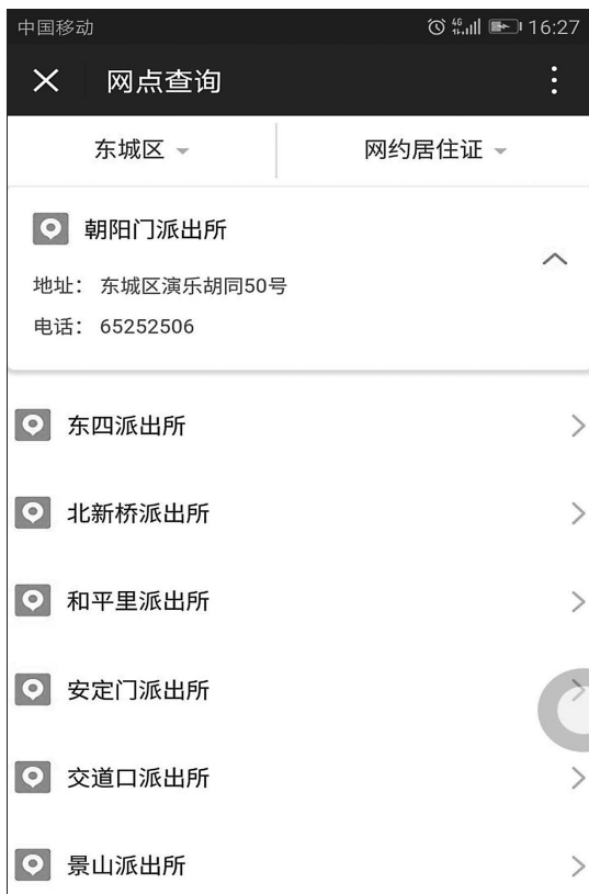
“北京市居住证”微信公众号使用界面