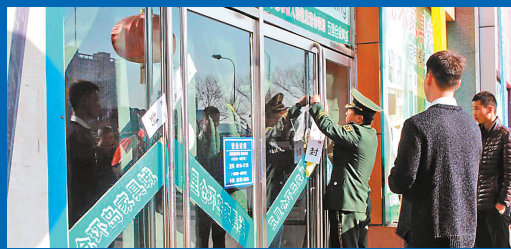
因存在消防隐患被依法查封

20年历史的五里仓家具城，是众多老顺义人买家具的好去处，这里经常是热热闹闹、生意火爆。如今，这座老家具城，却因为存在消防隐患而停业整改。近日，北青社区报记者从胜利街道获悉，五里仓家具城因存在消防隐患即将停业，所有样品会在11月25日前低价出售。而这家老店自1997年营业起，已伴顺义人走过了20年历程，承载着很多顺义人美好的回忆。最近几天，有不少顺义居民前来采购家具并拍照留念。