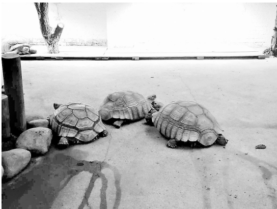
三只移动缓慢的龟