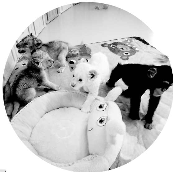
育幼中心的小动物在一起玩耍