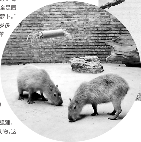
水豚又被称为“没尾巴的大老鼠”