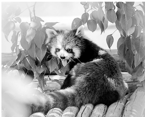
绿荫下乘凉的小浣熊