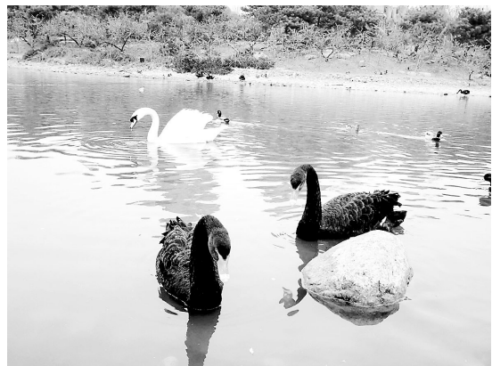
黑天鹅在湖里悠闲地游弋