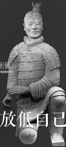
跪射俑 【秦始皇帝陵博物院】