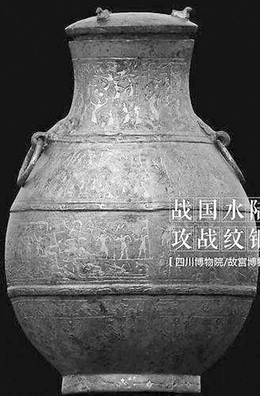
战国水陆 攻战纹铜壶 【四川博物院/故宫博物院】

错金银云纹青铜犀尊 现藏于中国国家博物馆。尊腹中空，用来盛酒。尊背有椭圆形口，口上有盖。犀牛口右侧有一圆管状的“流”。通体饰细如游丝的错金银云纹，熠熠生辉，华美无比。