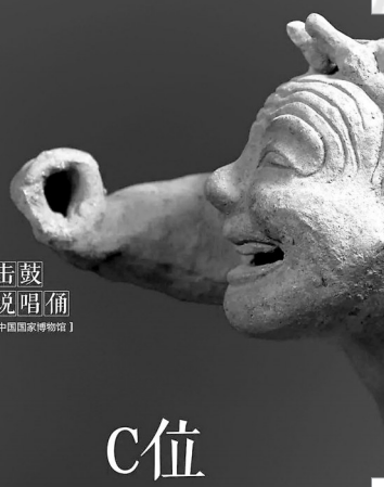
击鼓 说唱俑 【中国国家博物馆】