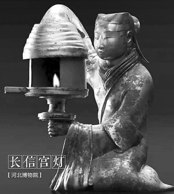
长信宫灯 【河北博物院】

现藏于秦始皇帝陵博物院。表情神态和发髻、甲片、履底等刻画生动传神。秦兵马俑坑至今已出土清理各种陶俑1000多尊，除跪射俑外，皆有不同程度的损坏，需要人工修复。而这尊跪射俑是保存最完整的、唯一一尊未经人工修复的。