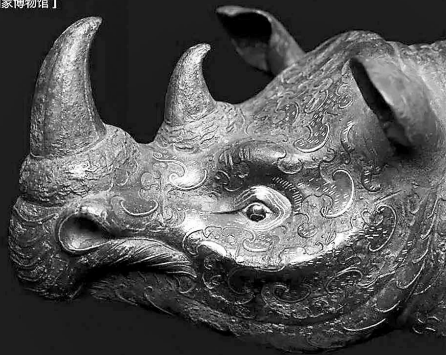
错金银云纹 青铜犀尊 【中国国家博物馆】