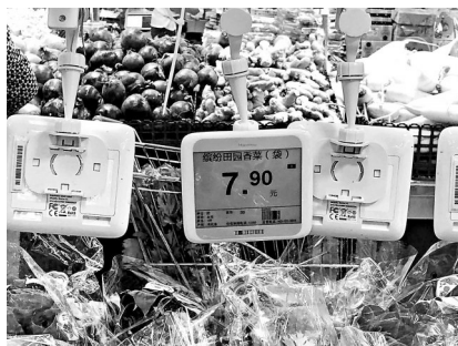
地市场显示的9月5日菜价中,京品种黄

记者随机挑选了两种前期较贵的蔬菜:黄瓜、油麦菜,进行对比。据超市促销员说,8月底的黄瓜价格约在5元钱一斤,而现在则降到了2.98元一斤。北京新发