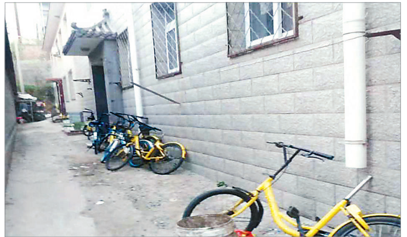
清理大宁村小黄车