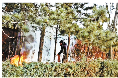
热心司机积极灭火

随后，记者赶到事发地点，看到周围已没有人，起火位置的树木及周围有燃烧过的痕迹，大概为10平方米，靠近仍有烧糊的味道。火情已在第一时间被处置，没有造成任何财产损失及危险。