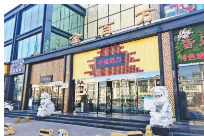
金百万顺义店正常营业

“饭店的服务员和名字都没变，卡就是不能用。”武女士说，她在丰台区一金百万饭店办理了会员卡，但不久前被告知，因原金百万饭店合同到期，饭店经营者换人了，她的会员卡无法继续全额使用，只能消费卡里金额的20%。