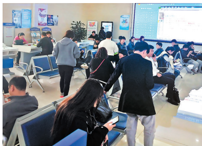
办税服务厅内居民众多