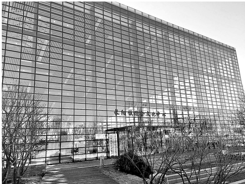
居民文化活动的地标。