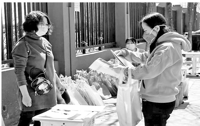
北京小学长阳分校发放教材现场

运、看管、通风干燥的场所存放教材资料。后勤保安组工作人员提前粘贴一米防冠线、温馨提示语,并准备好口罩、手套、消毒液等防护物资,做好组织和维持秩序工作。家长根据学校通知时间,有序排队,并“无接触”地领取教材,整个发