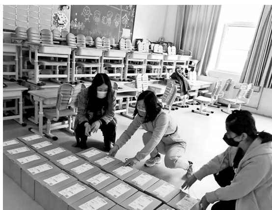
黄城根小学房山分校老师准备邮寄教材