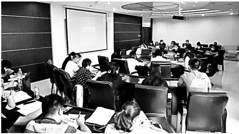
提高社区服务效能。

二、合理发放物资,善用平台功能,创新工作模式。合理运用线上征集令、公益直播等功能,进一步拓宽受众覆盖面积,