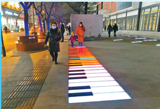
小朋友们踩在“琴键”之上,就会传来阵阵悠扬的琴音