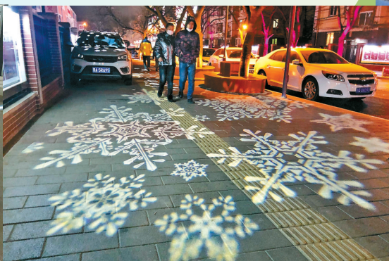
路侧安装了景观射灯,在步行道上投射下雪花等图案