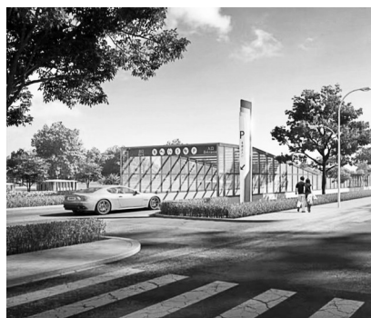
车行出入口效果图

据工作人员介绍,此处名为调色板花园的地下停车库位于石景山区黄庄 43 号北侧地块内,东至石槽中街,南至莲石东路,西至雕塑园南街,北至规划三路。该规划停车库服务范围涉及远洋山水、瑞达