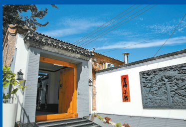
地址:大兴区北臧村镇诸葛营村诸葛营路41号 参考价:住宿2000元/晚;餐饮388元-888元/位

秋高气爽的季节,正适合带上家中老人团聚在当归小院,住翰林府,品谭家菜,饮五道酒,感受月下团圆的天伦之乐。