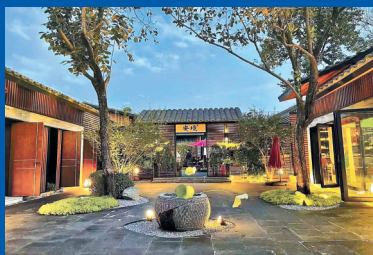
地址:石景山区模式口大街199号 参考价:中秋包院10860元

这两进式四合院既保留了有价值的老房和门道,又融入了奢华的现代配置。前院是水吧和酒吧,后院是雅致的民宿,私密性极好。白天,可以到周边的法海寺、龙泉寺、首钢园转转,也可以就在模式口文化街上走走,然后坐在阳伞下读书、闲谈。夜晚灯光亮起,月色、花影、虫鸣,在微凉的夜色中相得益彰,情趣盎然。不来一杯小酒吗?在这么舒服的境界里。