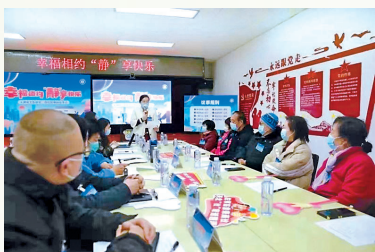
北二社区“回天有约”协商议事会

地面积800余平方米,铺设甬路,新建花坛,安装休闲坐椅,种植蔷薇、玉兰、樱花、海棠、丁香花等10余种绿植……历时将近两个月,居民期盼已久的口袋公园终于建成并投入使用。